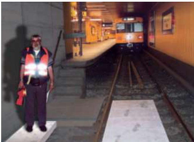
Пример применения плит D+2 в метрополитене Берлина

Динамически нагружаемые огнестойкие элементы «AESTUVER D+2» являются специальной разработкой для создания огнестойких дорожек для эвакуации людей рядом или на железнодорожных путях в подземной транспортной инфраструктуре.