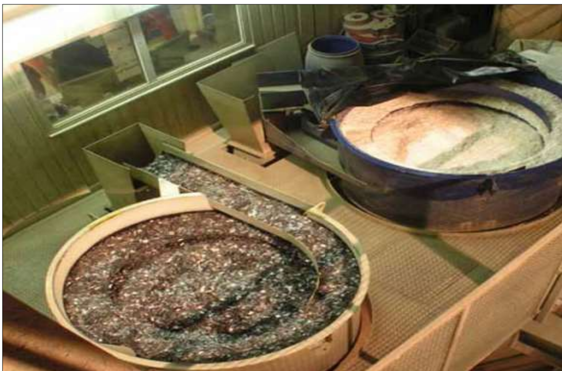
Рисунок 1 - Типовой внешний вид и конфигурация дозирующе-подающего устройства для подачи фибры.

6.6.2.1 в бетоносмеситель вводят последовательно сухие компоненты для приготовления бетонной смеси в соответствии с заданной рецептурой. Ведение необходимого количества фибры «PROZASK IGS» осуществляется дозирующими подающими устройствами, параллельно с затворением бетонной смеси и введением химических добавок. Типовой внешний вид и конфигурация дозирующе-подающего устройства для подачи фибры приведены на рисунке 1.