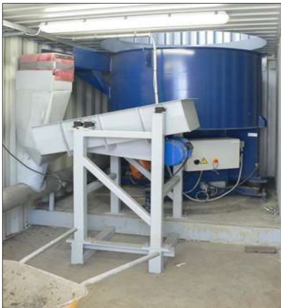
Рисунок 3 - Бункер взвешивания на ячейке загрузки для системы дозирования микрофибры.